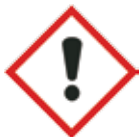
Irriterend, sensibiliserend, schadelijk