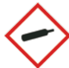
Gassen onder druk