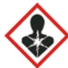
Lange termijn gezondheidsgevaarlijk