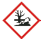
Gevaarlijk voor het aquatisch milieu